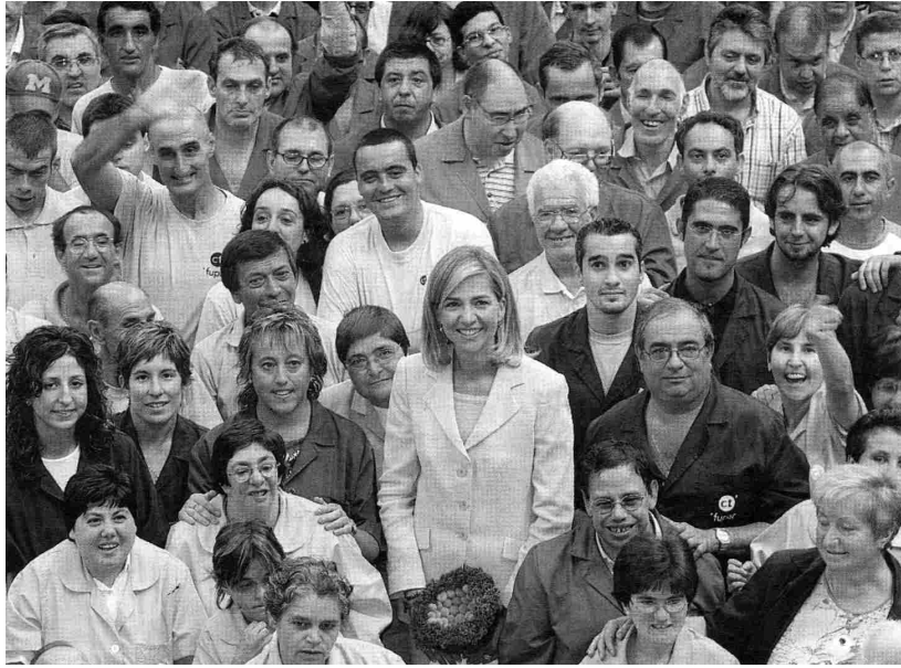
La duquesa de Palma, rodeada de trabajadores de Fupar