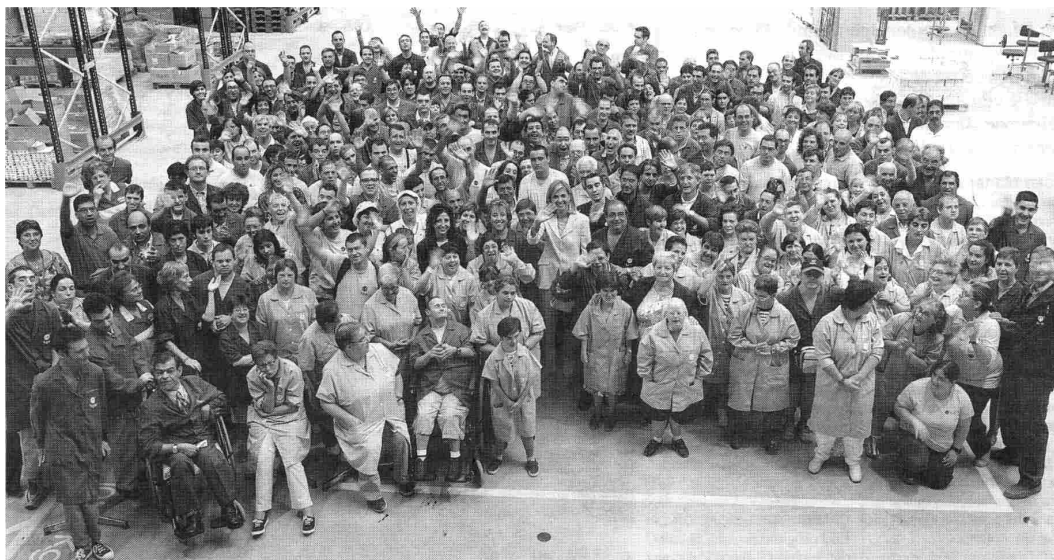
La infanta Cristina (en el centro) con trabajadores de Fupar en la nave central del nuevo edificio

Los nuevos talleres se levantan sobre una parcela de 9.400 metros cuadrados, en la zona Norte de la Llar de l'Ançianitat. El diseño es del ar-