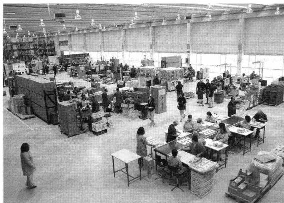
La nave principal tiene 2.700 metros cuadrados y está dotada de luz cenital

La superficie total es de catorce mil metros cuadrados. El inmueble consta de subterráneo, planta baja y primer