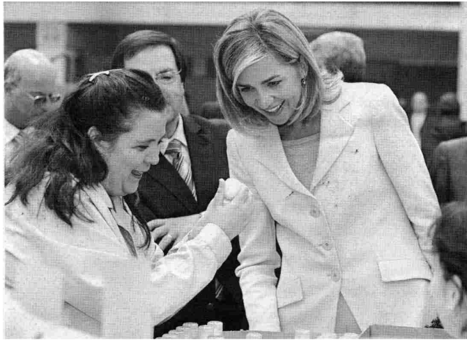
La duquesa de Palma se interesó por los productos que elabora Fupar

Cristina repartió besos y encajó manos, y vio como algunos trabajadores le hacían una reverencia. Los afortunados que la tuvieron más cerca