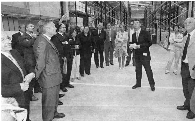
Representantes de la vida social, económica y cultural de Terrassa durante la visita

Policia Municipal. Los perros de los cuerpos de seguridad, adiestrados para la búsqueda de explosivos, tuvieron un trabajo extra, dentro y fuera del recinto. Sin una acreditación era imposible acceder a los talleres, en un acto dibujado al cien por cien por la Casa Real.