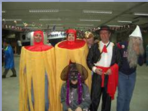
Ball de disfresses