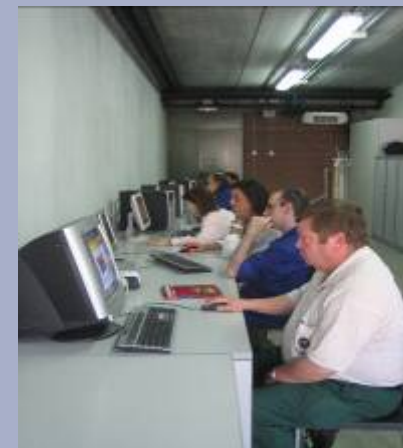
Informàtica - revista