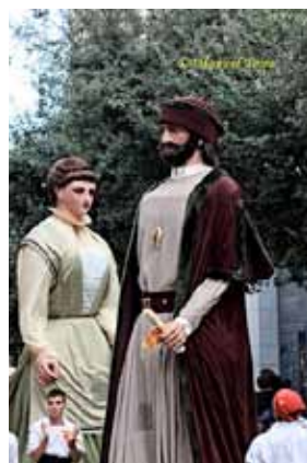
• GEGANTERS DE TERRASSA