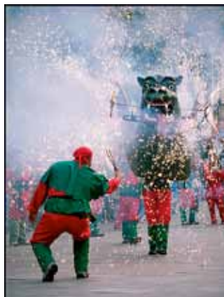
• DRAC DE TERRASSA

Estas son las fotos de la cultura popular de nuestra ciudad. Es un trabajo de investigación que he hecho en la actividad de periodismo.