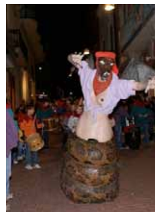
• PÁJARA DE TERRASSA