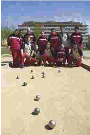
Equips participants al Campionat de Petanca.