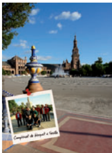
Fotografia de grup del viatge que es va realitzar en motiu del Campionat d'Espanya de bàsquet