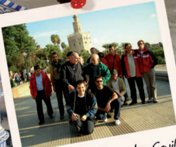
Campionat de bàsquet a Sevilla