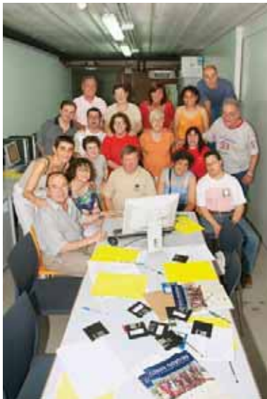
Retrat de grup de l'equip redactor de la revista.